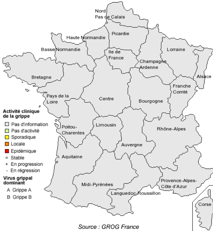
Situation de la grippe pour la semaine 2007/27

Partenaires : Institut de Veille Sanitaire, ORS Franche-Comté, URML Midi-Pyrénées, URML Limousin, URML Alsace, URML Centre, URML Pays-de-la-Loire, URML Nord-Pas-de-Calais, UPML Bourgogne, GEPIE DSP CHU de Nice, SCHS Mairie de St Etienne, CHU Miletrie Poitiers, REEPI Chambon-Feugerolles-Ricamarie, Service médical PSA Citroën Rennes, Services Médicaux HP France, Service Médical Ile-de-France-CNAMTS, Service de Santé des Armées, EDF-GDF, OCP-Répartition, Pharmactiv, Pharmaréférence, SOS Médecins France, MEDI'call Concept, Médecins d'Urgence 77 Sud, Association Médecins de Montagne, ACTIV, Laboratoires Pierre Fabre Santé, Laboratoires Sanofi Pasteur MSD, Laboratoires Solvay Pharma, Laboratoire Roche, Laboratoire Argène. Responsabilité scientifique : CNR des virus influenzae Régions Nord (Institut Pasteur-Paris) et Sud (HCL-Lyon), virologie CHU Caen, Open Rome. Coordination nationale : Open Rome, 67, rue du Poteau, F-75018 Paris. Tél: 01.56.55.51.51 Fax: 01.56.55.51.52 E-mail: openrome@openrome.org Site Web http://www.grog.org